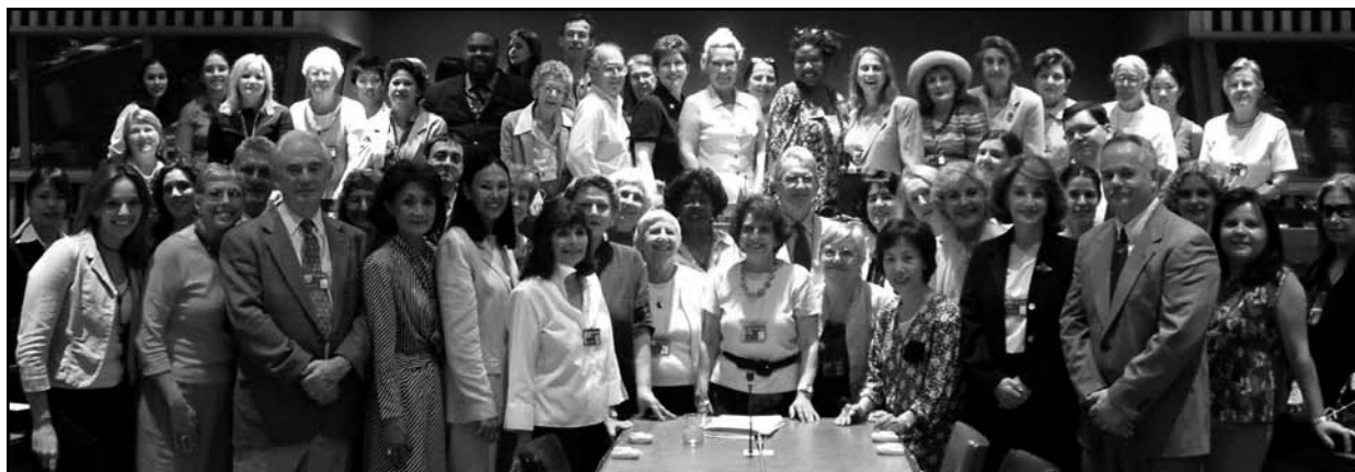
Membres du Comité de planification